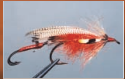
Branchu, voir p. 69

changeant la couleur du corps et en adaptant la grosseur de la mouche, il pouvait imiter presque toutes les émergences de phryganes apparaissant le long des rives des lacs qu'il fréquentait.