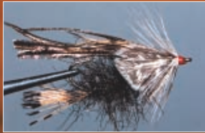
Presque Pas, voir p. 68