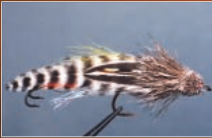
Matonipi, voir p. 67